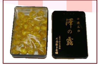
HAKKO GINGER 各種